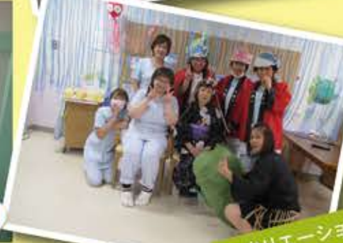
レクリエーション