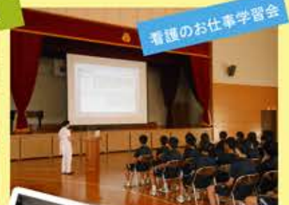
看護のお仕事学習会