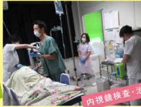
内視鏡検査・治療