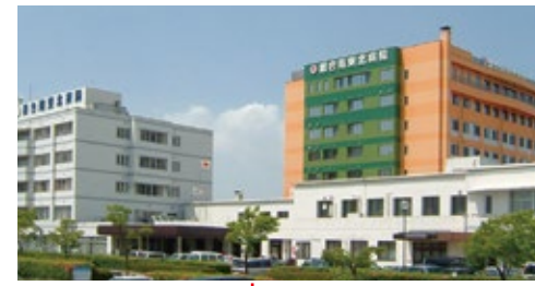
総合南東北病院 宮城県岩沼市