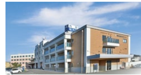
南東北春日リハビリテーション病院 福島県須賀川市