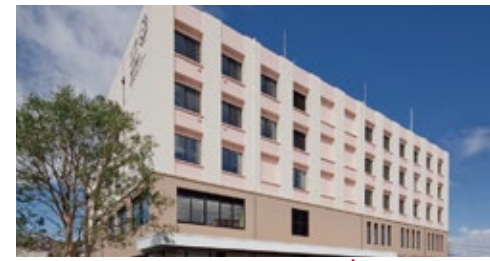
南東北BNCT研究センター 福島県郡山市