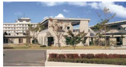
総合南東北福祉センター 福島県郡山市