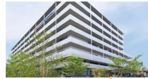
東京リハビリテーションセンター世田谷 東京都世田谷区