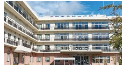
南東北第二病院 福島県郡山市