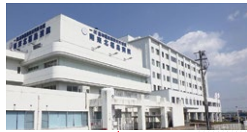
南東北福島病院 福島県福島市