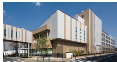
総合東京病院 東京都中野区