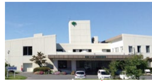
総合リハビリ美保野病院 青森県八戸市