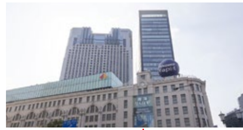
大阪なんばクリニック 大阪府大阪市中央区