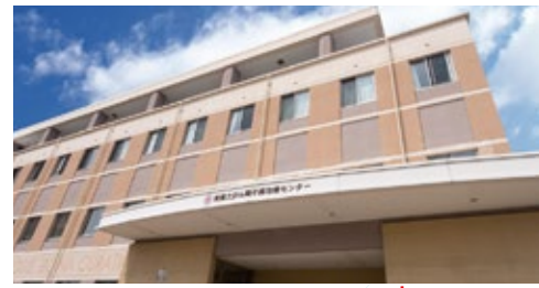
南東北がん陽子線治療センター 福島県郡山市