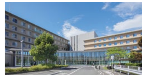
新百合ヶ丘総合病院 神奈川県川崎市