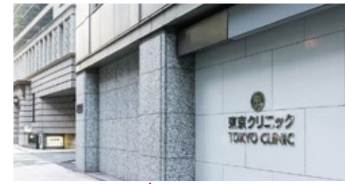
東京クリニック 東京都千代田区大手町