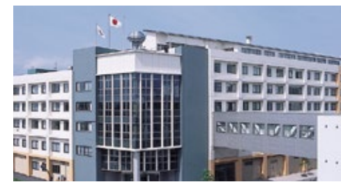
総合南東北病院 福島県郡山市

私たちは福島県、宮城県、青森県の東北3県及び、東京・神奈川の首都圏を基盤として、現在120以上の医療・介護・福祉施設を展開する「南東北グループ」の法人です。