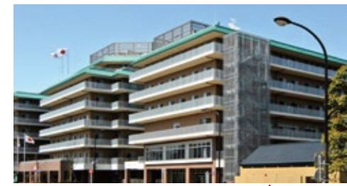
東京総合保健福祉センター江古田の森 東京都中野区