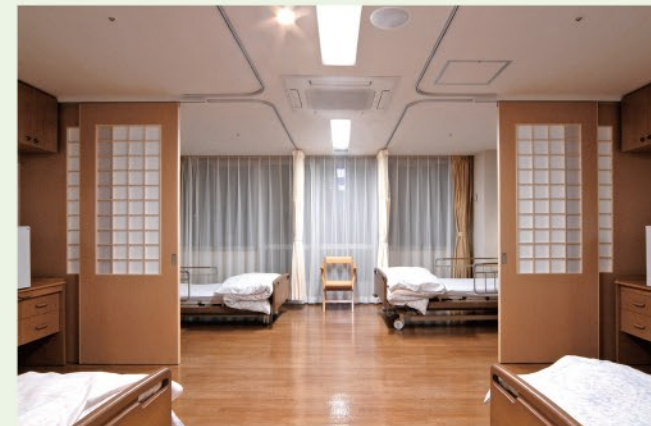
4人部屋(介護老人保健施設のみ)