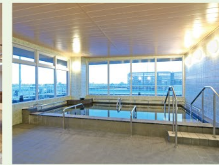
展望浴「富士見の湯」