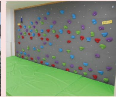
施設内にボルダリングなど遊具も豊富