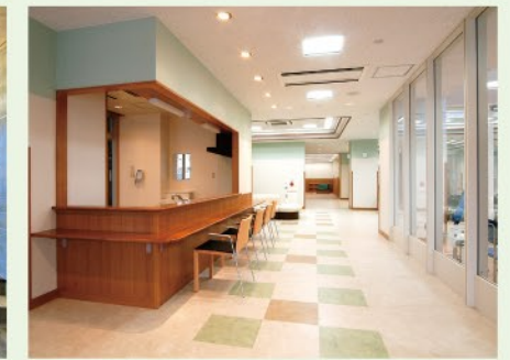
地域交流スペース・喫茶コーナー