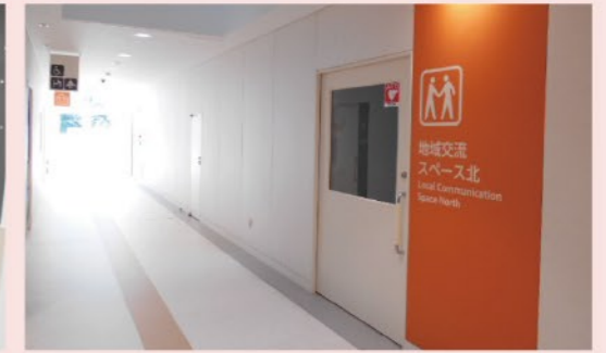
地域交流スペース