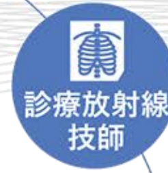
放射線課 Department of Radiology

さまざまなケースに適切かつ迅速に対応する一方、どんなときも患者さんのことを第一に考えて行動できるよう、他職種との連携を図り、チームとして取り組んでいます。 笑顔を決やらず、患者さんとそのご家族の心に寄り添った看護を提供いたします。