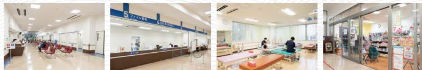
● 待合 ● 受付 ● リハビリテーション室 ● 売店