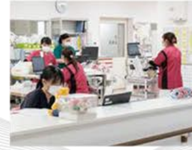
看護部 Nursing Department

さまざまなケースに適切かつ迅速に対応する一方、どんなときも患者さんのことを第一に考えて行動できるよう、他職種との連携を図り、チームとして取り組んでいます。 笑顔を決やらず、患者さんとそのご家族の心に寄り添った看護を提供いたします。