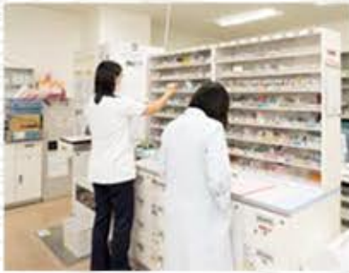
薬剤課 Department of Pharmacy

薬剤課の主な仕事は医薬品の供給や調剤、服薬している薬の薬剤管理指導、院内の各種チーム医療への参画を通じ、医薬品に関するすべての面で医療を支えることです。