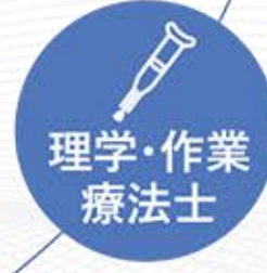
リハビリテーション課 Rehabilitation section

当院のリハビリテーション課は理学療法士と作業療法士、柔道整復師で、主として整形外科疾患の保存および術後や脳血管疾患、廃用症候群の患者様に対して、適切な訓練や動作練習などを行い、一日も早い在宅復帰および社会復帰を目指すための支援を行っております。