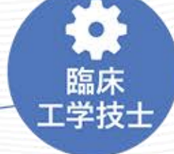
臨床工学課 Clinical Engineering Division

病院内のすべての医療機器が毎日、正常に使用できるように管理し、点検や修理を行っているのが、私たち臨床工学技士です。臨床工学技士はその名の通り「臨床」に携わる「工学」の知識を持った医療職です。