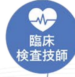
検査課 Inspection Division

医師が病気の診断をし、治療をしていくためには、患者様の体の状態を知ることが求められます。患者様の体から発せられる様々なサインを確認するために診察が行われ、それを確かめるために臨床検査が行われます。