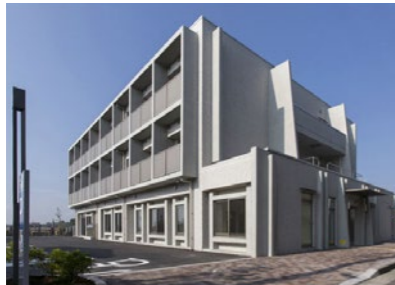
障害福祉サービス事業所 ゆかり荘