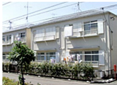
グループホーム ふじハイツ