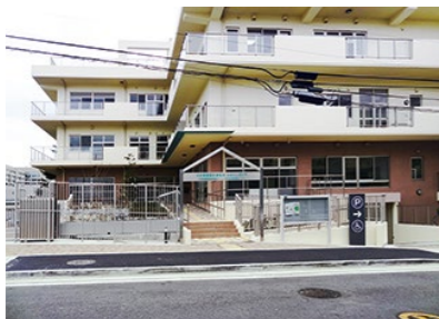
横浜市中区生活支援センター