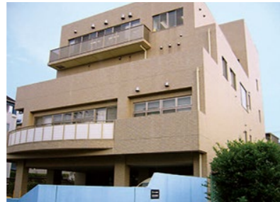
横浜市緑区生活支援センター